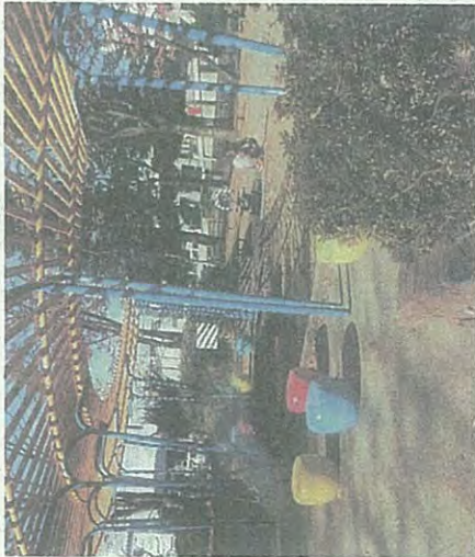
整備された松木公園で遊ぶ親子

◆地元町内から松木公園スツール(丸型のベンチ)が傷んできたので補修してほしいと要望があり、区公園課に依頼。この度、赤・青・黄の鮮やかな3色スツールになりました。【地元町内会では毎月第一日曜に清掃を実施し、清潔な公園管理に努めています】