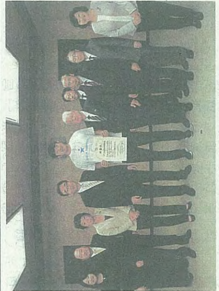
仙台市から感謝状が贈呈