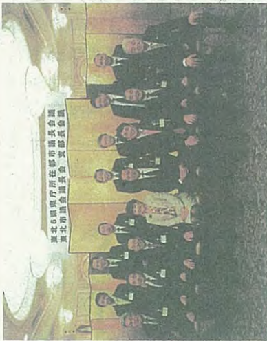
地元市長と6県議長