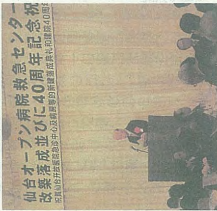
市議会を代表し挨拶