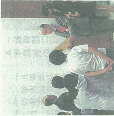
優秀な花壇づくりを表彰