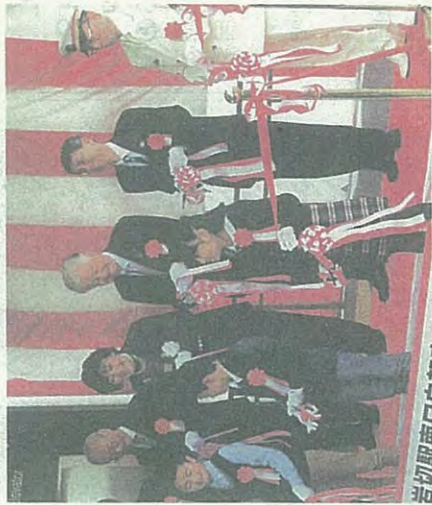
地元の小學生とテープカット