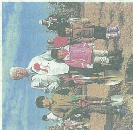
地元の小學生と植樹