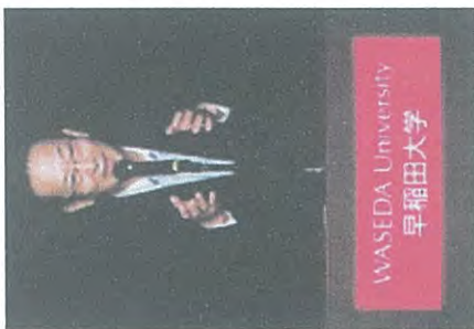
北川正恭顧問の挨拶

11日 公明党仙台市議団で早稲田大学大隈講堂で開催の全国地方議会サミット2018「議会のチカラで日本創生」に参加。【写真】