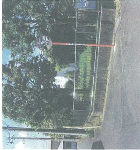
公園角にカーブミラー

遠見塚1丁目4号公園角にカーブミラーが設置されました。地域の方から見通しが悪い交差点と相談され、区役所に設置を要望しておりました