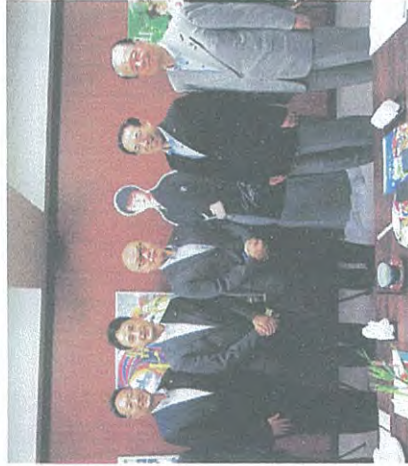
仙台・徳島両市議会の代表

11日 市議会で徳島市を訪問。雀踊り・阿波おどりを通し、姉妹都市交流を促進。【写真】