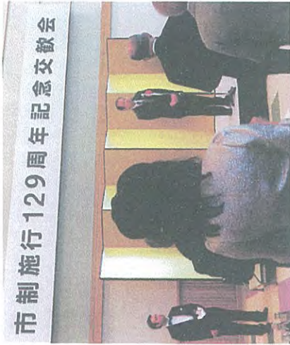
市制施行129周年記念交教会