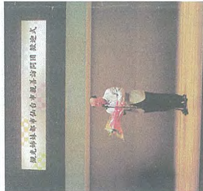
訪問団歓迎式典で挨拶

11日 市議会で徳島市を訪問。雀踊り・阿波おどりを通し、姉妹都市交流を促進。【写真】