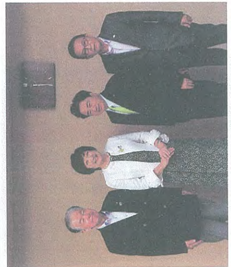
総社市長・議長が来仙