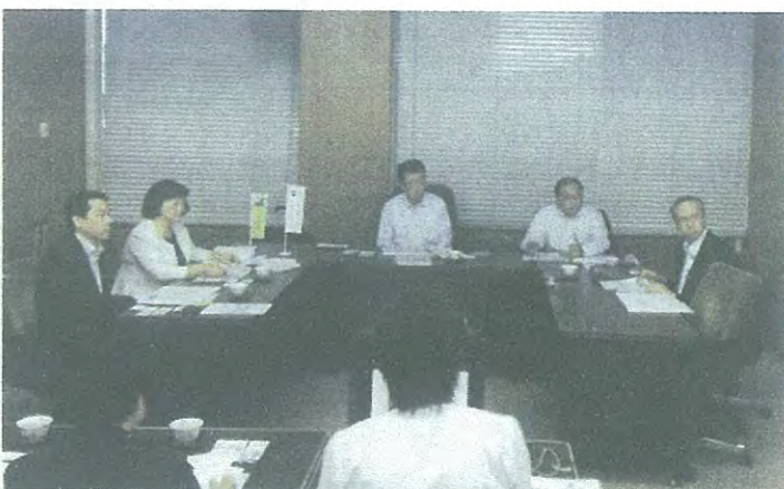
岐阜市：窓口業務の待ち時間解消策等の視察 (岐阜市) 5月23日