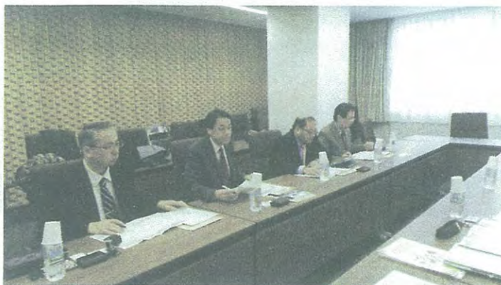
富山県：子育て支援の取り組み等の視察 (富山県庁) 3月23日