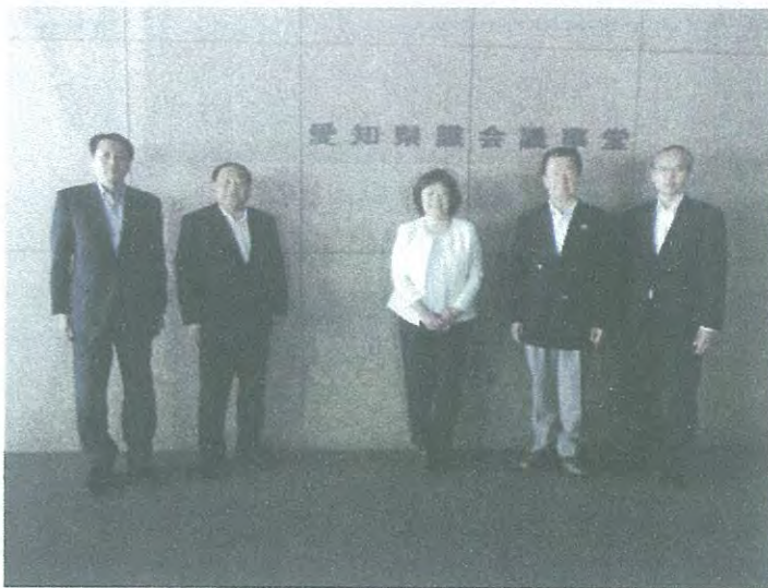
愛知県：子育て支援の取り組み等の視察 (愛知県庁) 5月23日