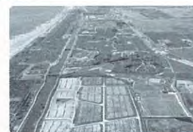
東部海岸部の集団移転跡地