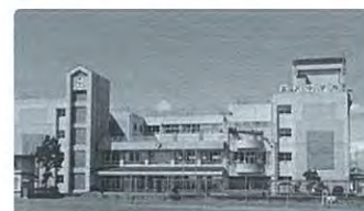
市内有数の大規模校である富沢中学校