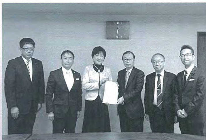
平成30年10月22日 郡和子市長に会派の基本政策を提言

既に事業を営んでいる中小企業・小規模事業者において、後継者が先代から事業を引き継いだ場合などに業態転換や新事業・新分野に進出すること。