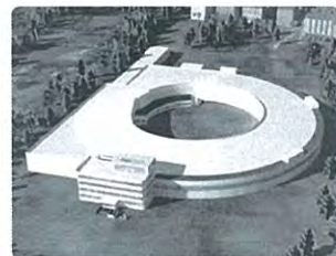
東北放射光施設のイメージ図