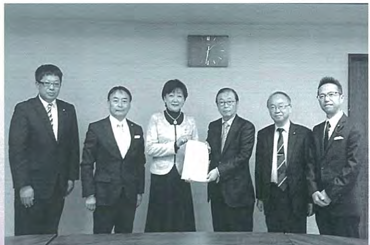
平成30年10月22日 郡和子市長に会派の基本政策を提言

既に事業を営んでいる中小企業・小規模事業者において、後継者が先代から事業を引き継いだ場合などに業態転換や新事業・新分野に進出すること。