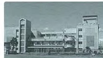
市内有数の大規模校である富沢中学校