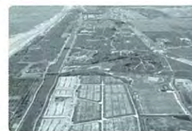
東部海岸部の集団移転跡地