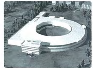
東北放射光施設のイメージ図